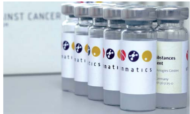
Nachhaltig verbesserte Lebensbedingungen: Die Immatix Biotechnologies entwickelt eine neue Impftechnologie gegen eine Vielzahl von Krebserkrankungen

Nutzen Sie Ihre Beteiligung im MIG 12 als wertvollen Baustein in Ihrem systematischen Vermögensaufbau.