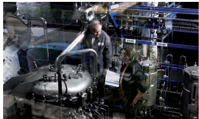
Umweltschonende Industrieprozesse: Bei der BRAIN AG wird CO 2 nicht nur gebunden, sondern als nützlicher Rohstoff weiterverwertet